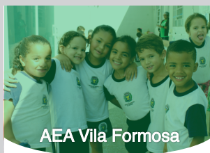
AEA Vila Formosa

R. Bernardino de Campos, 636 aea@aeacampinas.org.br (19) 3233-3393 Diretoria Conselhos Fiscal e de Administração: 18 pessoas envolvidas Principais fontes de recursos: IPCAMP; FEAC; Nota Fiscal Paulista; doadores diversos